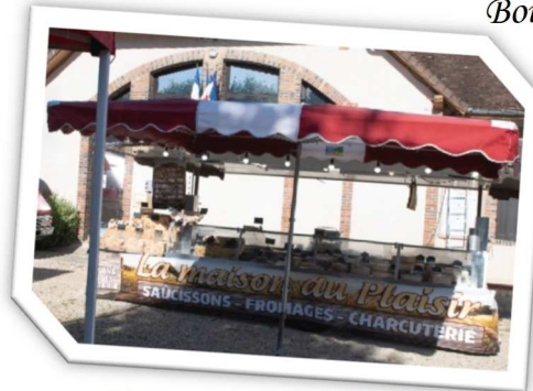
Fromages et saucissons