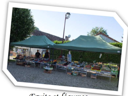
Fruits et légumes